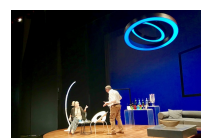
Barbareschi e Noschese in "L'anatra all'arancia"