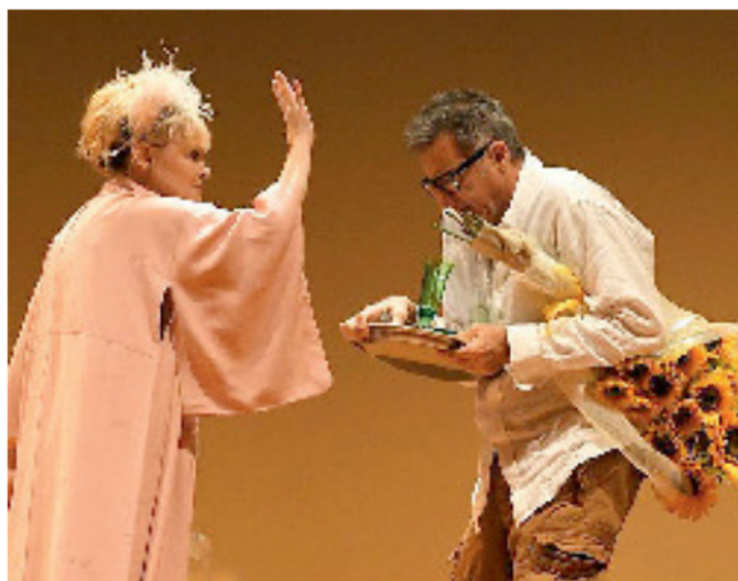
Chiara Noschese e Luca Barbareschi in “L’anatra all’arancia”