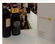
Il Consorzio a Vinitaly 2016