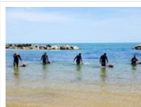
Montesilvano, “Riviera in Festa con gli amici animali”