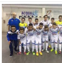
Acqua&Sapone Emmegross, niente vacanze per i baby