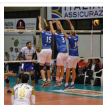
Volley, Tuscania- Ortona 0-3