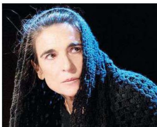
Lina Sastri porterà in scena "La Lupa" stasera al Fenaroli di Lanciano