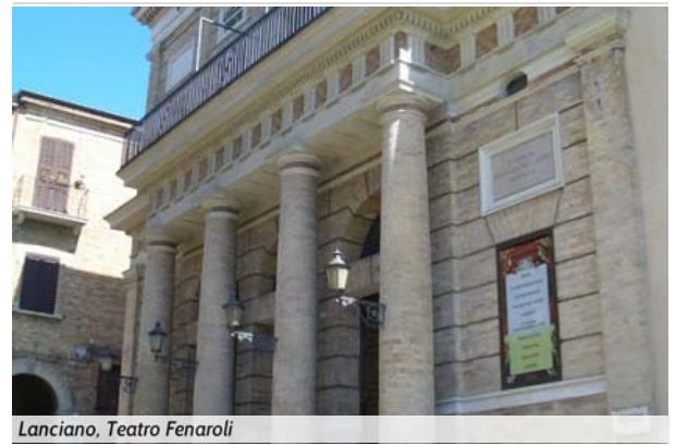
Lanciano, Teatro Fenaroli

di Filippo Marfisi Il Teatro Fenaroli di Lanciano vedrà nei prossimi 19, 20 e 21 aprile la riedizione della celebre commedia musicale "Aggiungi Un Posto A Tavola" nella sua prima edizione italiana autorizzata dagli autori e dagli eredi dopo le 5 precedenti di esclusiva del Teatro Sistina di Roma. Lo spettacolo debutterà al Teatro