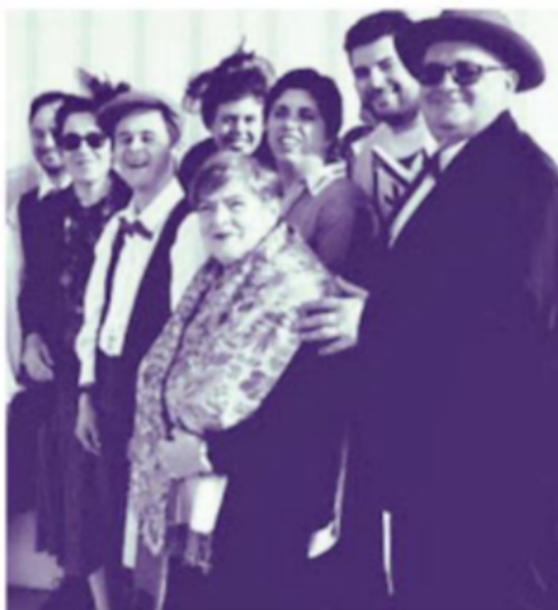
La compagnia L'Aquilone dell'Anfass

Con una commedia ispirata a un celebre copione di Eduardo De Filippo si conclude oggi a Lanciano la 19ª Rassegna di teatro dialettale, organizzata dall'associazione Amici della Ribalta per il cartellone 2023-24 del teatro Fenaroli. Appuntamento alle 17 per l'assegnazione del Premio Città di Lanciano "Maschera d'oro" fra quanti hanno partecipato alla rassegna. A fine cerimonia la compagnia L'Aquilone dell'onlus Anfass di Lanciano porterà in scena, con la regia di Lilia Giangregorio, Non ti pago... più , liberamente tratto dalla commedia in tre atti del 1940 di Eduardo De Filippo Non ti pago . Il protagonista della pièce, Ferdinando Quagliuolo, alla morte del padre eredita la gestione di un banco lotto. Lui stesso è accanito giocatore, nonostante la costante sfortuna. Invece il suo