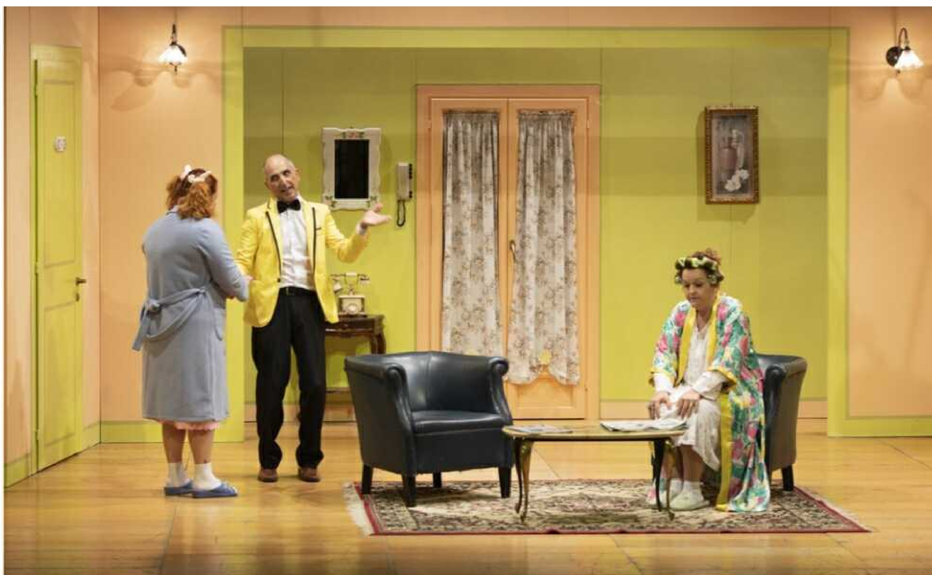
Una scena della commedia

Biglietti nei punti vendita del circuito Ciaotickets e al botteghino del teatro oggi , dalle 16 alle 19 e domani , a partire dalle 10. Info e prenotazioni 339 8201983.