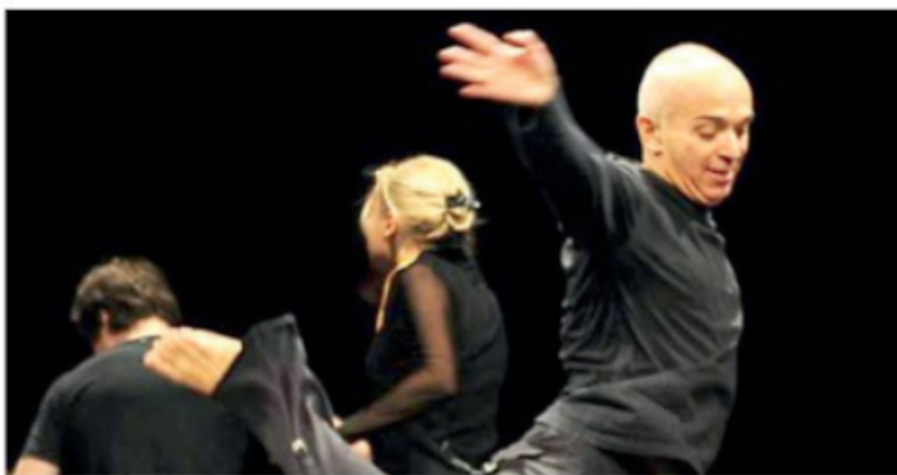
Gli attori dell'accademia "Nico Pepe" in una scena di "Bomb voyage"