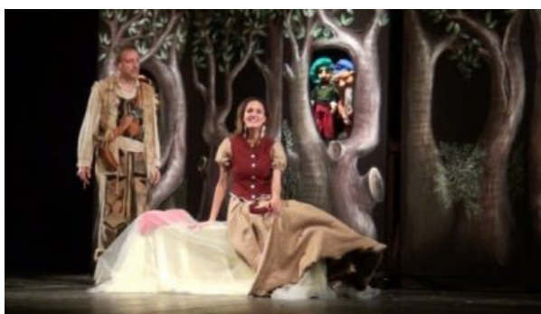
I Guardiani dell' Oca

Per concludere le festività natalizie, la Stagione Teatrale 2019/2020 ci propone una favola dal fascino intramontabile. Il Teatro Fenaroli ospiterà domenica 5 GENNAIO 2020 alle ore 17.00 . "Biancaneve e i sette Nani", nell'ambito della rassegna di teatro ragazzi "Racconti d'Inverno", a cura dei "Guardiani dell'Oca" di Guardiagrele.