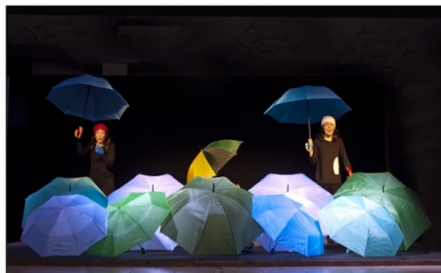
"Con la luna per mano" - iteatrini.it